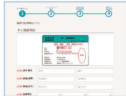
オンラインユーザー登録画面

URL https://pepup.life/users/ekyc/ToY98Civ/sign_up